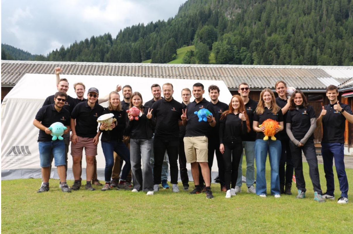
Vor Ort: das Helferteam des Saanen Kids Camp 2025

38 Kinder aus unterschiedlichsten Hintergründen kamen zusammen, viele von ihnen zum ersten Mal in einem Camp. Manche schüchtern, andere vorfreudig aufgedreht – aber alle voller Neugier. Begleitet wurden sie von rund 24 Helfenden pro Tag – junge Menschen, Rotarierinnen, Rotactracterinnen, ehemalige Teilnehmerinnen – alle mit dem gemeinsamen Wunsch, diese Woche zu etwas Besonderem zu machen. Und sie wurde besonders. Für uns alle.