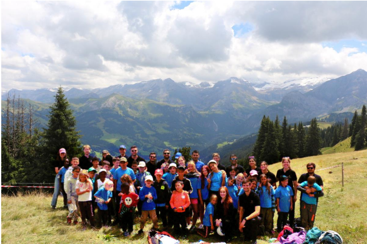
Ausflug mit der Gondel auf die Wispile

Zurück im Camp ging es sportlich weiter mit unseren Olympischen Spielen : Laufen, Springen, Balancieren – aber vor allem: Anfeuern. Trösten. Gemeinsam lachen. Kein Wettkampf im klassischen Sinn, sondern ein Feiern der Vielfalt, der Bewegungsfreude und der gegenseitigen Unterstützung.